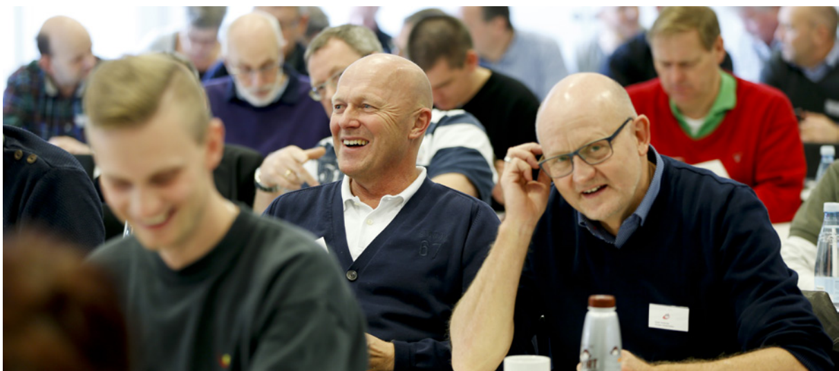
Deltagere fra idrætscentre over hele landet blev både underholdt, inspireret og inddraget på årets Campus.