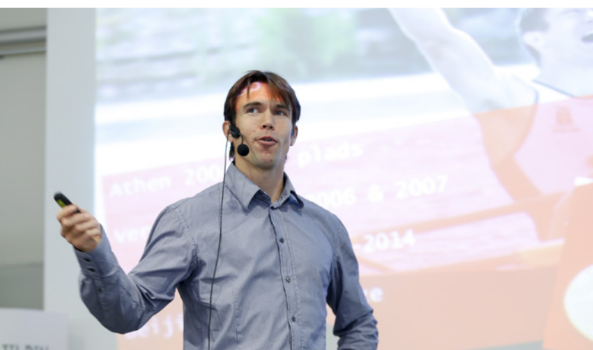
Det sunde måltid skal være let at få fat i, så man spiser sundt, selv om man er på farten, lød det fra eliteroer Mads Rasmussen.

I 16 år har Mads Rasmussen været eliteroer og har vundet guld ved både VM og OL. Ud over benhård målrettet træning handler det for ham også om at spise det rigtige, når han skal præstere på toppen.