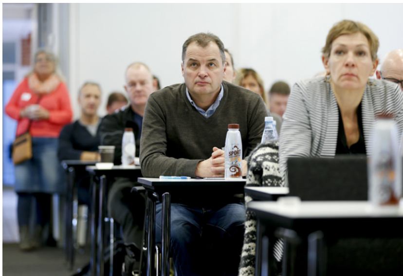
På Campus fik deltagerne mulighed for at smage på nogle af Arla's on-the-go produkter som Mathilde Sport med ekstra protein.

Foran samtlige deltagere i salen stod en Mathilde Sport med ekstra protein. Et eksempel